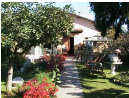
Casa del Sale - Det är här vi smider och äter. Några av oss kommer också att bo här.

Vet du inte vad du vill göra får du givetvis hjälp med att komma på något bra. Det kan vara smycken, bruksföremål eller mindre konstobjekt. Ta gärna med skissmaterial och färdiga skisser om du har.